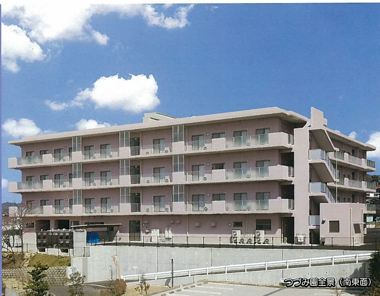
つつみ園全景（南東面）