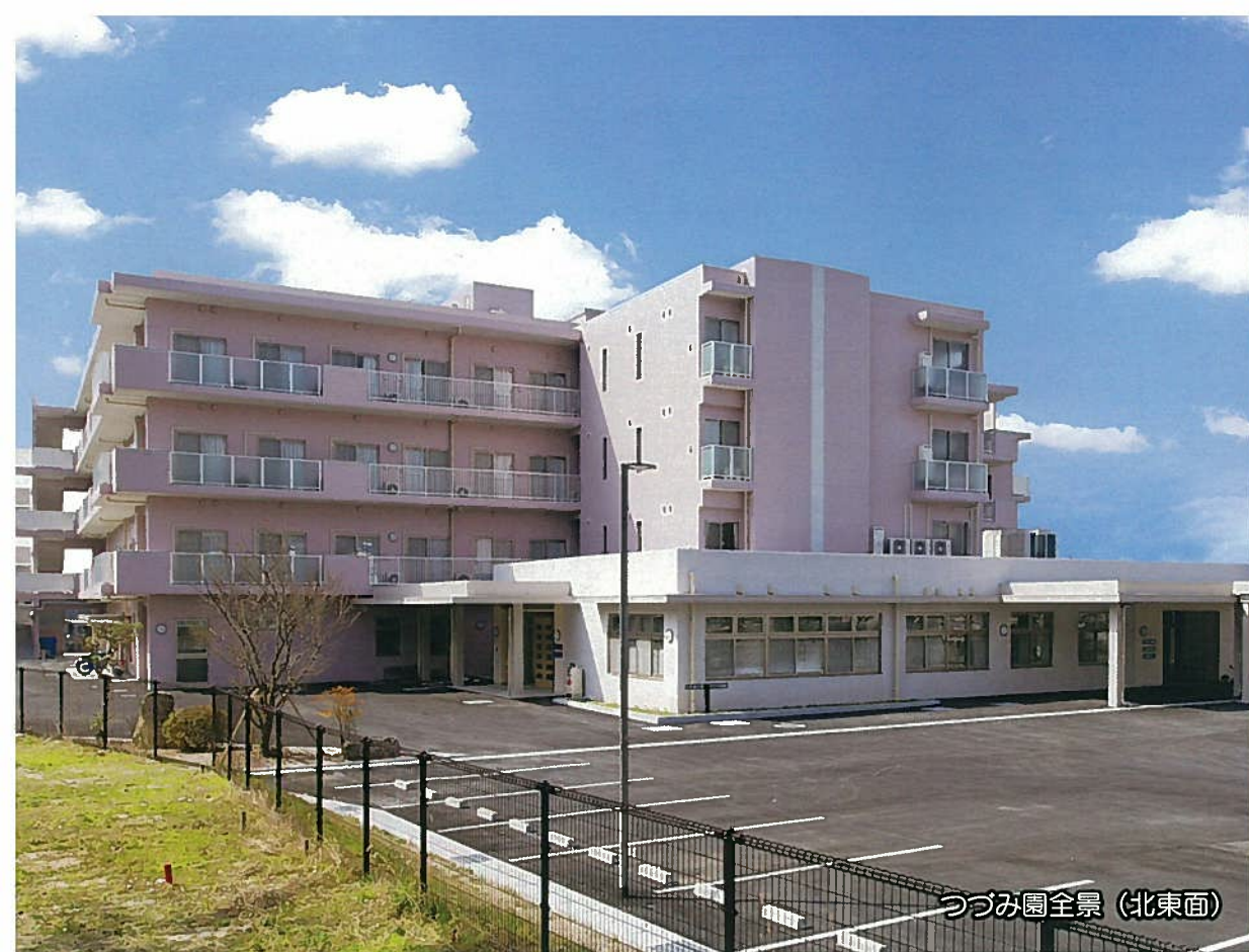
つつみ園全景（北東面）