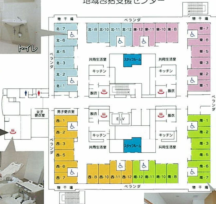
▲2階：さるびあ 3階：いずみ 4階：万葉